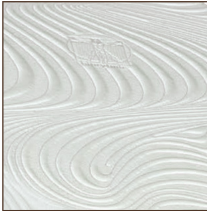
detail potáhu matraca

Látka BIORYTMIC s obsahom prírodných minerálov, ktoré vyžarovaním prírodzenej energie pozitívne ovplyvňujú vnútrotelovú „komunikáciu“ a prúdenie energetických tokov. Tie sú zodpovedné za správne fungovanie organizmu, čo je základný predpoklad pre predchádzanie chorobám a udržanie si zdravia. Pôsobením minerálov sa budete cítiť omladení, zníži sa úroveň stresu, váš organizmus bude lepšie relaxovať, regenerovať a budete sa cítiť lepšie. Prebúdzat' sa budete s pocitom sviežosti, odpočinutí a vaše telo bude plné sily a energie.